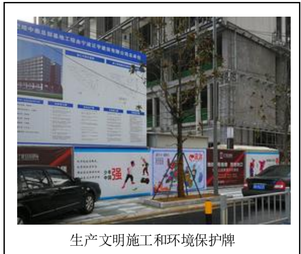
生产文明施工和环境保护牌