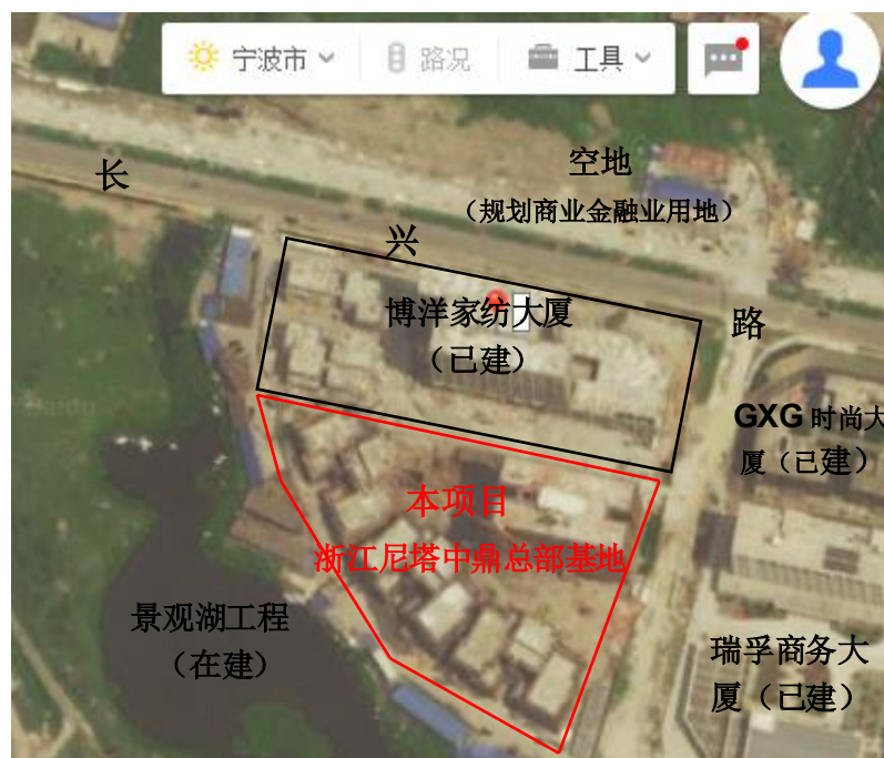
图 3.1-2 项目四周环境概况图