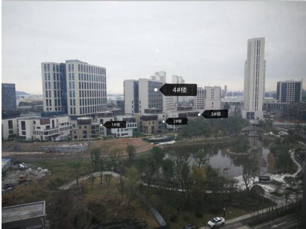
图 3.1-3 项目全景照