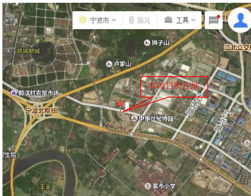
图 3.1-1 项目地理位置图

宁波市江北区投资创业中心门户区长兴路以南 2-2 地块，东邻拟建望山路（延伸段），隔路为 GXG 时尚大厦、瑞孚商务大厦；南侧和西侧邻宁波北门户商务区一期地块配套景观湖工程（在建），北侧博洋家纺商务大厦）。项目具体地理位置见图 3.1-1，周围环境示意图见图 3.1-2，项目全景照见图 3.1-3。